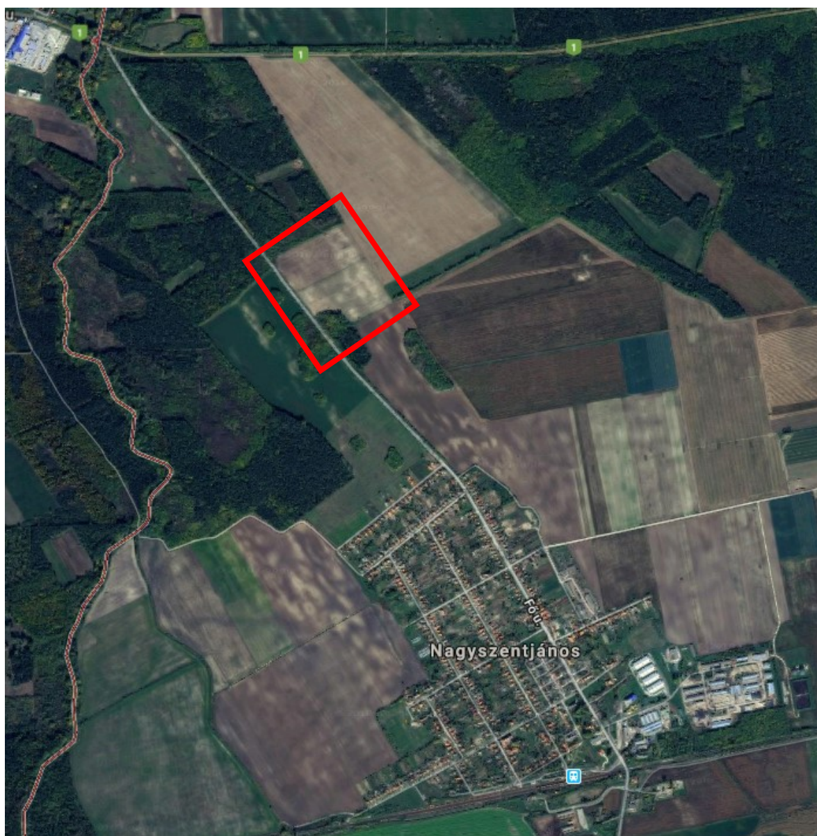
tervezési terület ortofotón